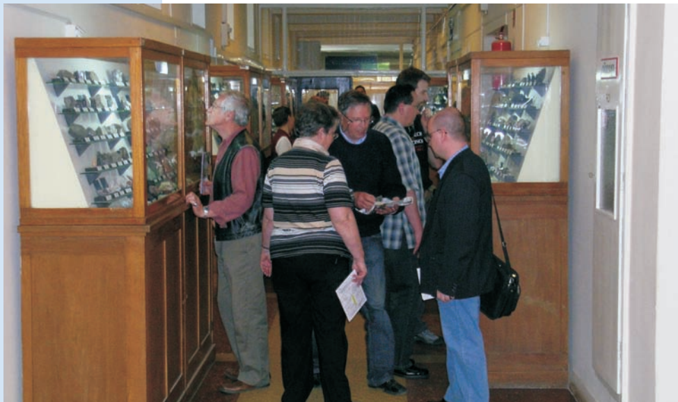
Az előadóiülés előtt a Miskolci Egyetem Ásvány- és Kőzettani Tanszékének folyosóján, az ásványrendszertani kiállítás vitrinjei közt.

előadóknak számos kérdésre kellett válaszolniuk. A sikeren felbuzdulva elképzelhető, hogy a jövőben minden évben tartunk egy-